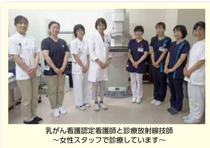
乳がん看護認定看護師と診療放射線技師 ～女性スタッフで診療しています～

日本人の乳がん罹患率は年々増加しており、女性のがんの中では最も頻度が高くなっています。乳がんは40代から60代に罹患のピークがあり、働き世代・子育て世代を襲いますが、早期発見・早期治療にて治癒する可能性の高いがんです。ガイドラインに沿った適切な標準治療を受けていただくことで根治を共に目指します。