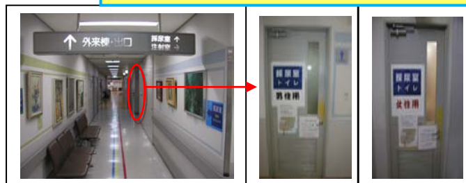
採尿室トイレの入口（写真4）