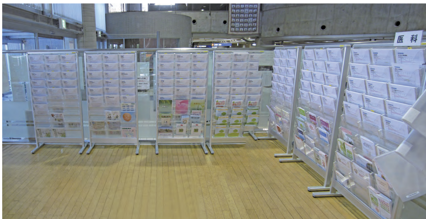
【正面玄関横の情報コーナー】 (地域の医療機関のご案内)

注1) 地理的条件や日常生活、交通事情等の社会的条件によりエリアごとに都道府県が定めています。群馬県内には10地域の二次医療圏があり、桐生厚生総合病院は桐生保健医療圏（桐生市及びみどり市）に属します。